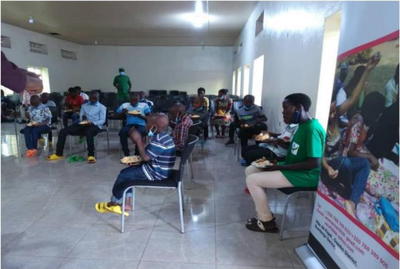
This was an operation in partnership with district to collect back street child to their Home. We cooked together at sector office and give them new clothes.