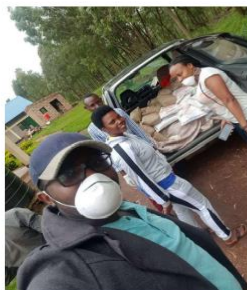
masks were distributed to single mothers with children during the pandemic