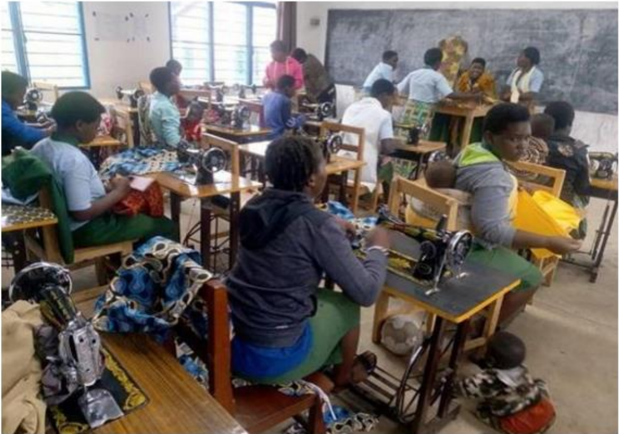
handy craft work offered for woman as Tailer and tourist gifts