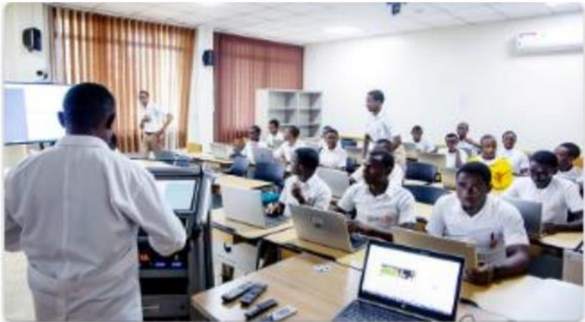
Look in front of 😊